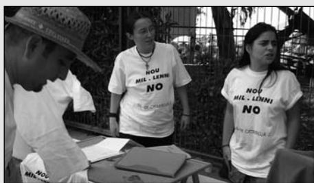
Recollida de signatures durant les festes de 2005.

Sort que ja s'ha produït un moviment d'oposició a aquest desfici. Alguns partits polítics i, sobretot, la plataforma veïnal «Salvem Catarroja» estem lluitant per una Catarroja més digna. Als llauradors del meu poble els recomane que, en nom de la seua terra, hi col·laboren.